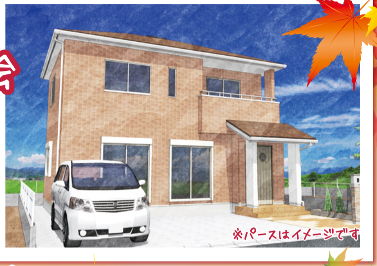
※パースはイメージです