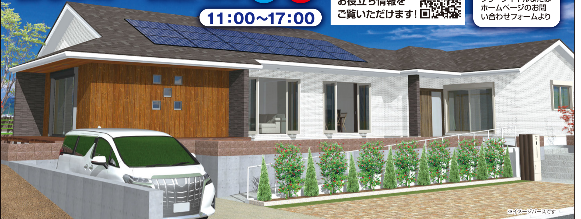
※イメージバースです